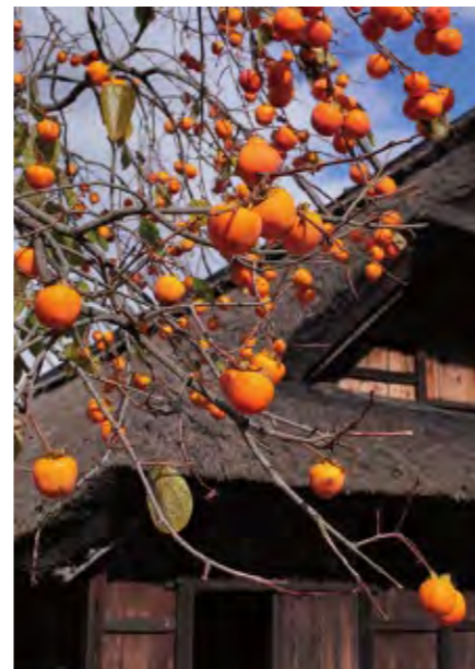
昔は庭に柿の木のある家が多かった