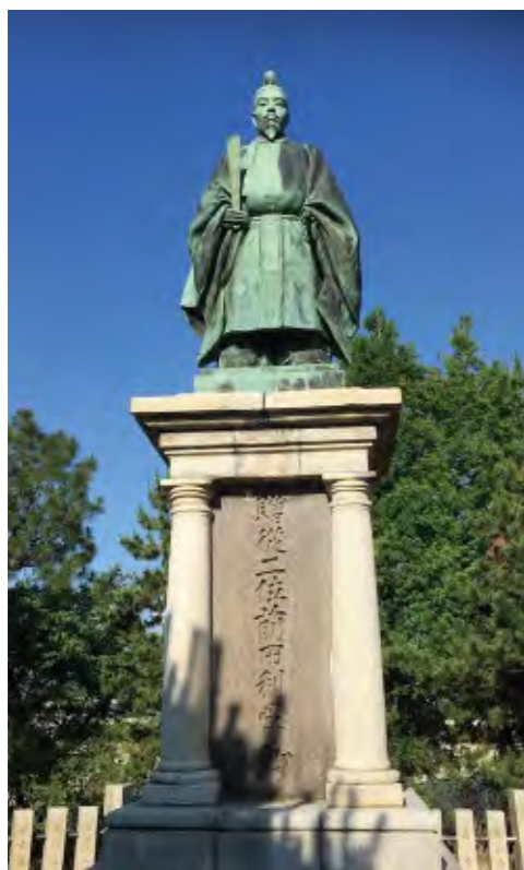
小松城の前田利常像

金沢歴活代表。1974年兵庫県生。金沢市在住。関西学院大学大学院文学研究科日本史学専修卒業。専門は日本近世史。金沢で歴史イベントや講座を定期開催中