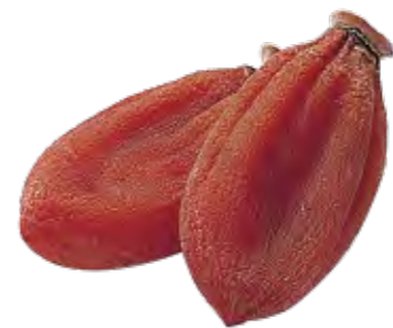
志賀町の「ころ柿」は高級干柿として知られる

さわし柿とは、生の果実の状態です。渋抜きしたものを選びます。遅くまで樹にならせたり、収穫後に箱などに安置して熟柿にするものと、短期間でさわす方法に分けられます。前者には、床の間に置くと味が良くなるなんていう話もあるんだとか。短期間でさわす方法は、お湯で渋を抜く方法がもっとも古く、江戸時代後半にはアルコールを使う方法が生まれました。