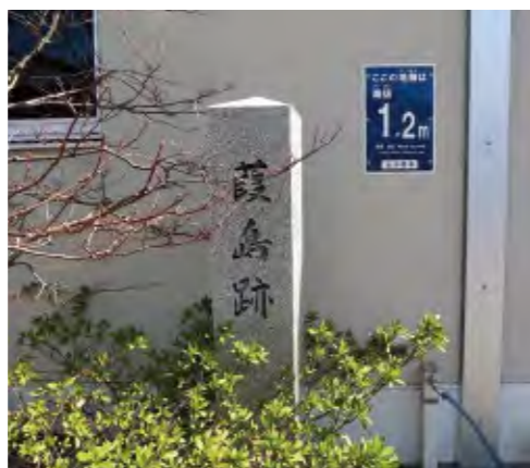
前田利常が柿を植えた、小松城葭島跡

て生産されたのは、元禄期頃からのようです。その頃の記録には、加賀国では吉岡村(白山市)、能登国では西山村(輪島市)や五十里村(能登町)で串柿が作られていました。享保期には七原村(白山市)で甘柿の大和柿がつくられ、金沢でも使用されるようになったほか、知気寺村(白山市)では熟柿が特産品となります。