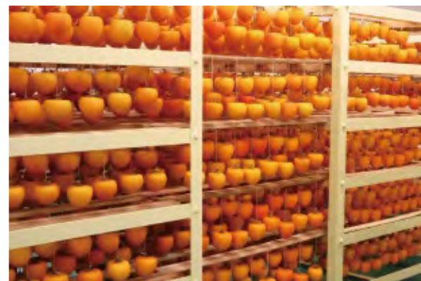
志賀町の農家ではころ柿づくりが盛ん